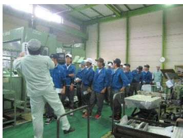
工場見学の様子です

6月8日と15日に高校生の工場見学がありました。弊社では、入社1年目と2年目が高校生、中学生の工場見学の案内担当をします。私は、今年入社2年目で、1年目の社員と一緒に工場見学を担当しました。会社説明をパワーポイントで行い、その後、工場見学をしました。加工している製品の紹介や、機械、溶接加工の説明、レーザー加工の実演、技能五輪(旋盤・構造物鉄工)の実演を見学しました。高校生に少しでも、興味を持っていただき、将来の職業選択の参考になってもらえれば、嬉しいです。