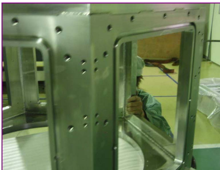
今月のチャンバ 3 写真:左

材 質 : SUS304 構 造 : 溶接構造 仕上げ : 内面 #400 : 外面 溶接後機械加工 各面の直角出し サイズ : 六角形 Φ1400×H700